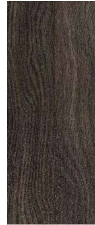
Roble Cáceres Texturado