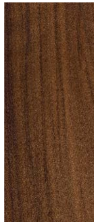
Nogal Europeo Texturado