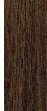
Roble Ibérico Texturado