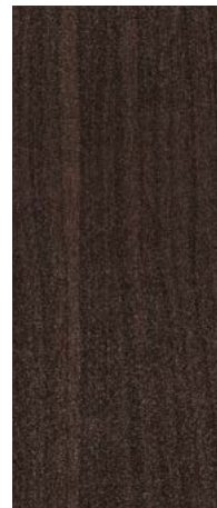
Nogal Oscuro Texturado