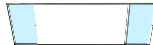
Ouverture dans chaque sens