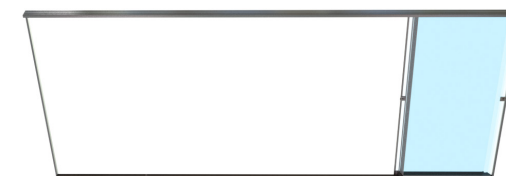
Ouverture à droite