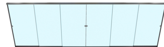
Système complètement fermé